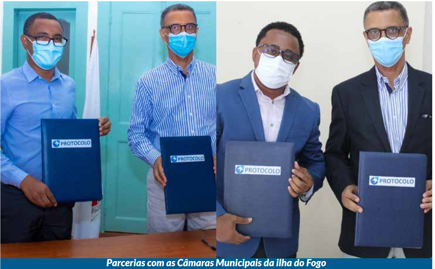
Parcerias com as Câmaras Municipais da ilha do Fogo

A identificação e mapeamento de instituições internas e externas a Cabo Verde, com potencial de agregação de valor, através de cooperação técnica e institucional, é, também, um dos desígnios da Pró Empresa. Assim, foram firmados alguns acordos com vista à implementação de linhas de cooperação para qualificação e desenvolvimento de novos produtos e serviços da Pró Empresa e não só.