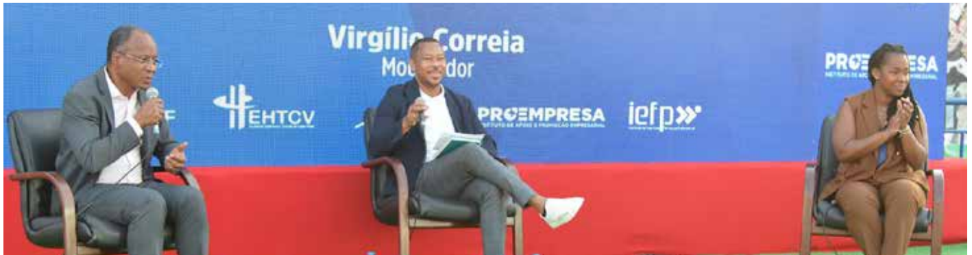
Conversa aberta com o primeiro ministro