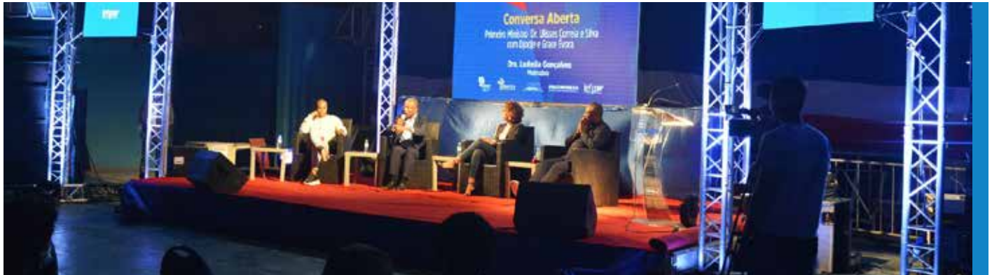
Conversa aberta com o primeiro ministro

A promoção e a participação em feiras e outros eventos nacionais e internacionais visam, essencialmente, que a comunidade empresarial atinja uma maior dinamização, principalmente, das Start Ups nacionais, através do conhecimento de novas realidades, ideias, experiências, iniciativas e soluções no circuito nacional e internacional.