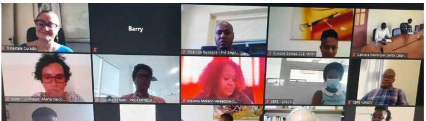
Capacitação Incubadoras ANPROTEC

Foram beneficiários desta ação gestores de incubadoras atuantes, profissionais envolvidos no planeamento, implementação e operação das incubadoras de empresas e a equipa da Pró Empresa.