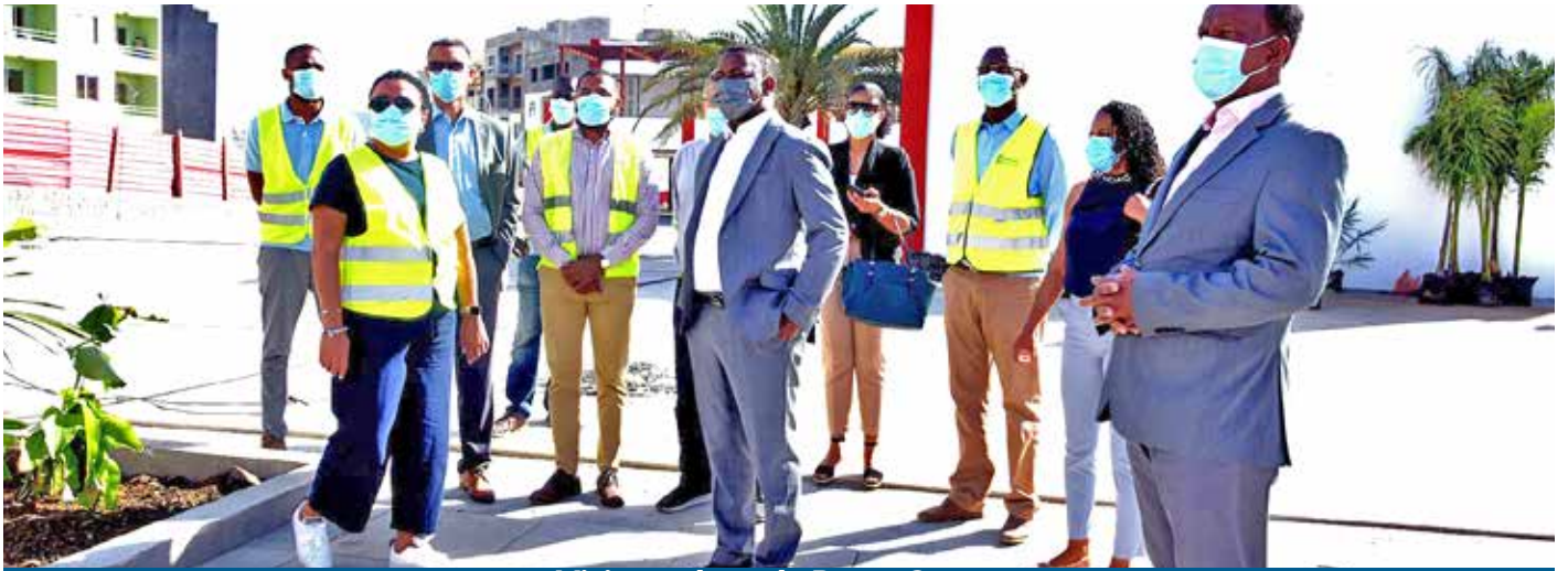
Visita a obras da Praça Center