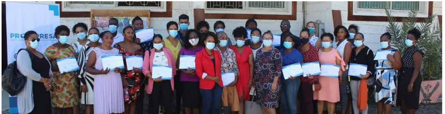
Projeto Formalização de Negócios – Sucupira

As ações foram, também, reforçadas com a orientação empresarial e esclarecimentos sobre o regime REMPE, Segurança Social (INPS) e encargos fiscais.