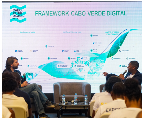
Workshop Empreendedorismo de Tecnológica FEFE