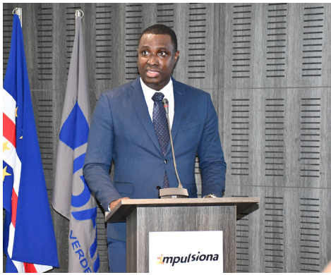
Lançamento do Programa Impulsiona