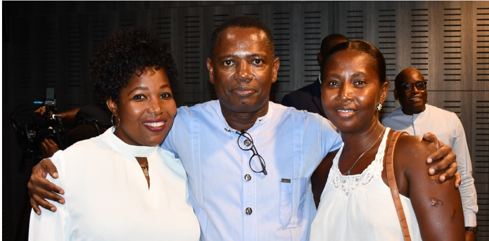
Conversa Aberta do VPM com Mulheres Empreendedoras