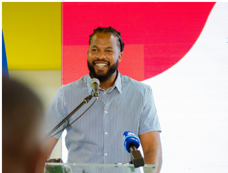
Lançamento SUJ 100%