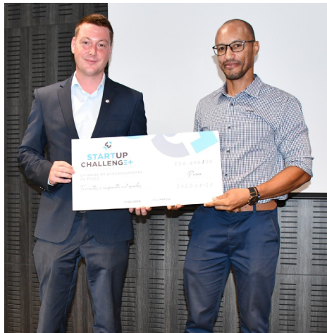
Premiação Startup Challenge+