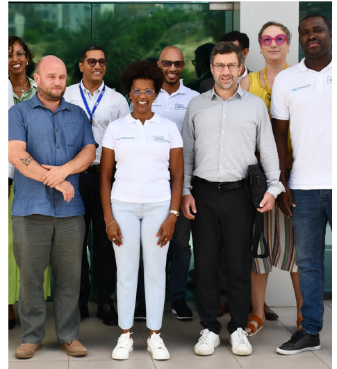
Visita da Cooperação Luxemburguesa