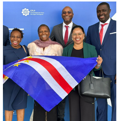
II Diálogo sobre Pequenos Negócios e Empreendedorismo no âmbito da CPLP - Luanda