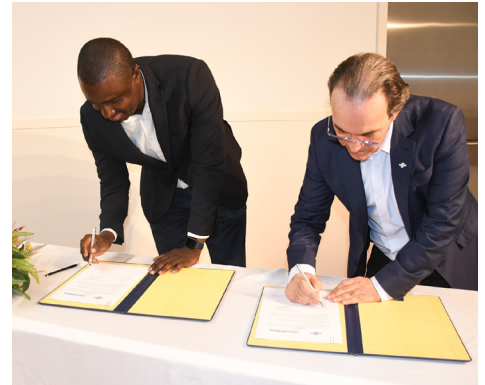
Assinatura de Protocolo Pró Empresa - SEBRAE