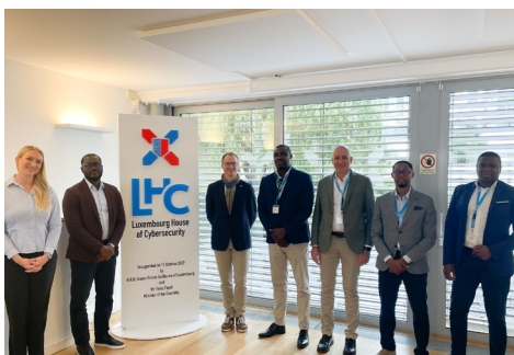
Visita ao Ecossistema de Inovação de Luxemburgo