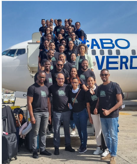
Comitiva Web Summit 2023