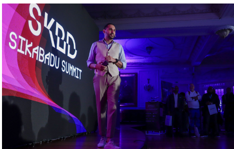
Evento Sikabadu - Web Summit Lisboa